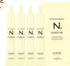
N. ケラリファイン カラーケア ＜ヘアトリートメント＞ 15g×4 1,200円+税