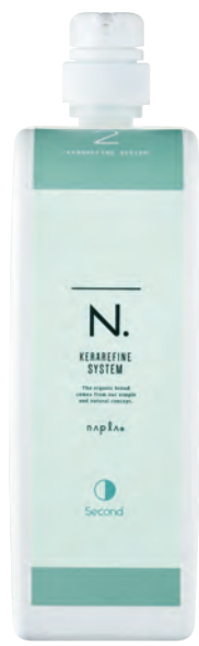
N. ケラリファイン システムトリートメント 2nd ＜ヘアトリートメント＞ 1,000g (リフィル)

pHチェンジすることで1stの3種類のケラチンとケラチンアミノ酸が凝集化を開始。分子量が増大し、髪のコアの強度を高めます。