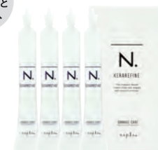
N. ケラリファイン ダメージケア ＜ヘアトリートメント＞ 15g×4 1,200円+税