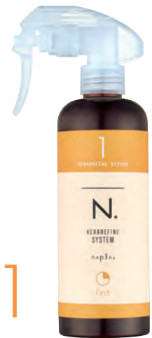
N. ケラリファイン システムトリートメント 1st ＜ヘアトリートメントミストタイプ＞ 300mL / 600mL (リフィル)

凝集化のキーとなるフェザーケラチン、II型還元ケラチン、Phy-ケラチンを毛髪内部に均一に分散・浸透させます。