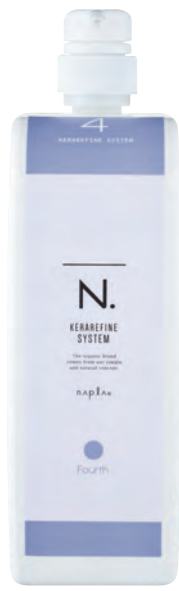
N. ケラリファイン システムトリートメント 4th ＜ヘアトリートメント＞ 1,000g (リフィル)

I型還元ケラチンが毛髪表面のケラチンとシスチン結合しキューティクルを補修。Wセルロースポリマーの耐水性コートにより、なめらかな指通りが持続します。