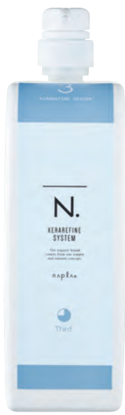
N. ケラリファイン システムトリートメント 3rd ＜ヘアトリートメント＞ 1,000g (リフィル)

髪の間～表面部の補修成分を補給し、凝集化が完結。キューティクルを内側から接着し、髪表面をなめらかに整えます。